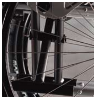
System trójramiennego krzyżaka Zapewnia wytrzymałość przy zmniejszonym ciężarze i eleganckim wyglądzie