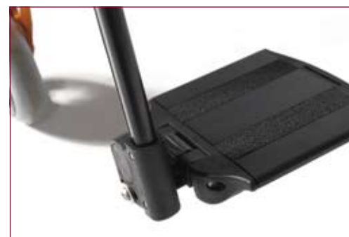
Dzielona aluminiowa płyta podnóżka Regulacja kąta i głębokości

Oferowany z 3 długościami ramy, ze standardowymi i aktywnymi wieszakami, zarówno 70^{\circ} jak i 80^{\circ}