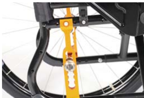
Siedmiopozycyjna regulacja wysokości siedziska Z pochylaniem w zakresie 0^{\circ} – 4^{\circ} . Podpora osi dostępna w 3 anodowanych kolorach (pomarańczowy, czarny i srebrny)