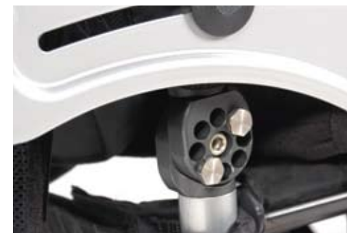
Regulacja kąta nachylenia oparcia (opcjonalnie) Mały ciężar i łatwość regulacji. Umożliwia regulację kąta w zakresie 18^{\circ} , od -9^{\circ} do +9^{\circ} z przyrostami 3^{\circ}