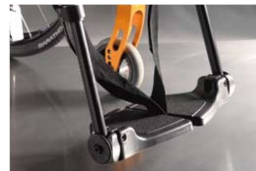
Dzielona kompozytowa płyta podnóżka Z regulacją kąta