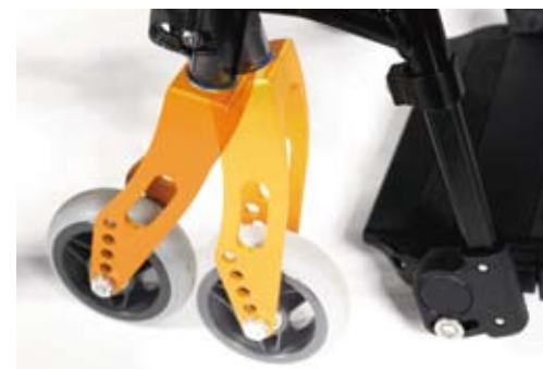
Łatwa i szybka regulacja kąta widetek Rozszerzony zakres kątów zapewni optymalne właściwości jezdne