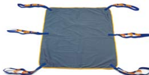
Tabela doboru temblaka :